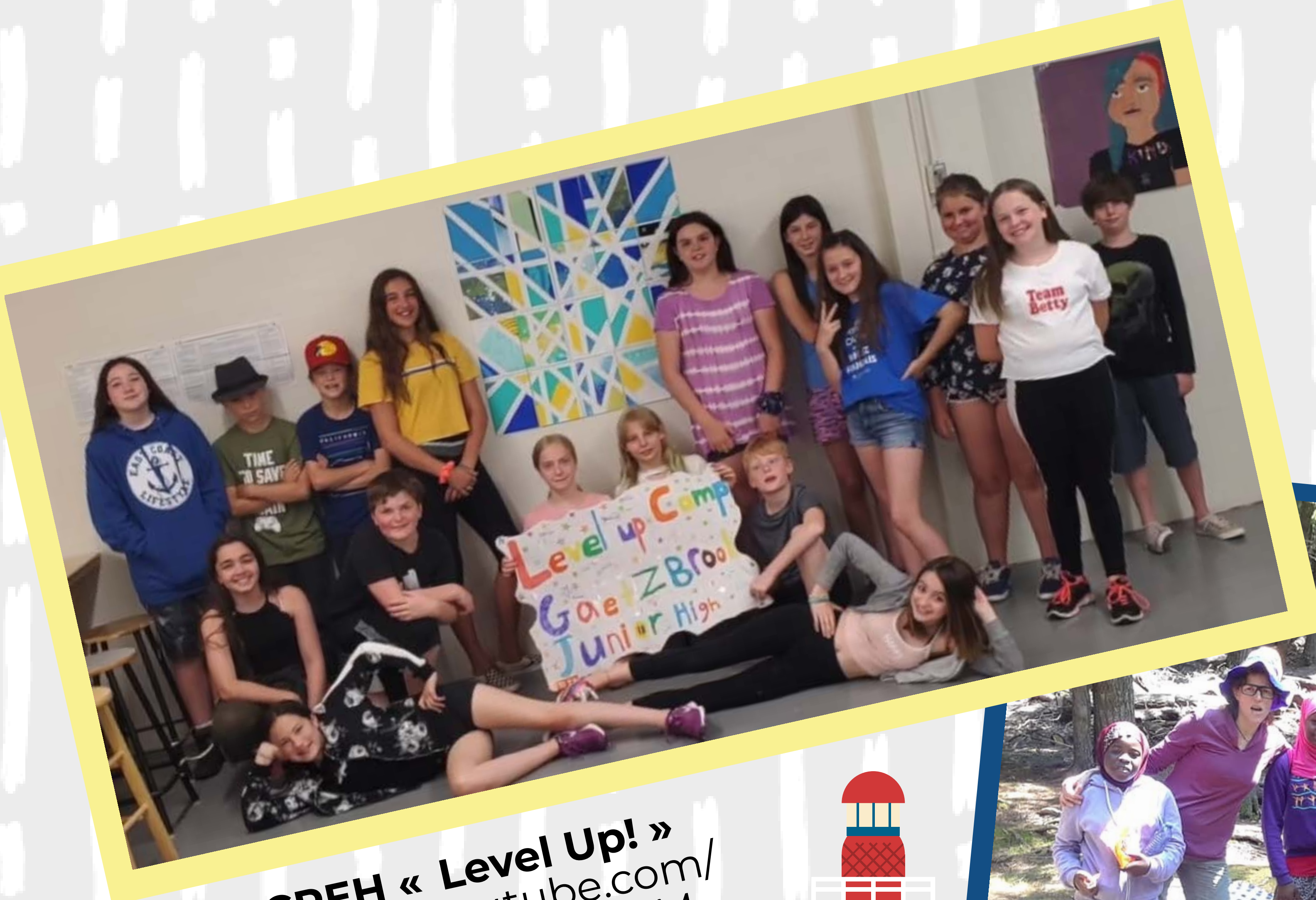
EP CREH « Level Up! » https://www.youtube.com/watch?v=0bsndrcv8hM